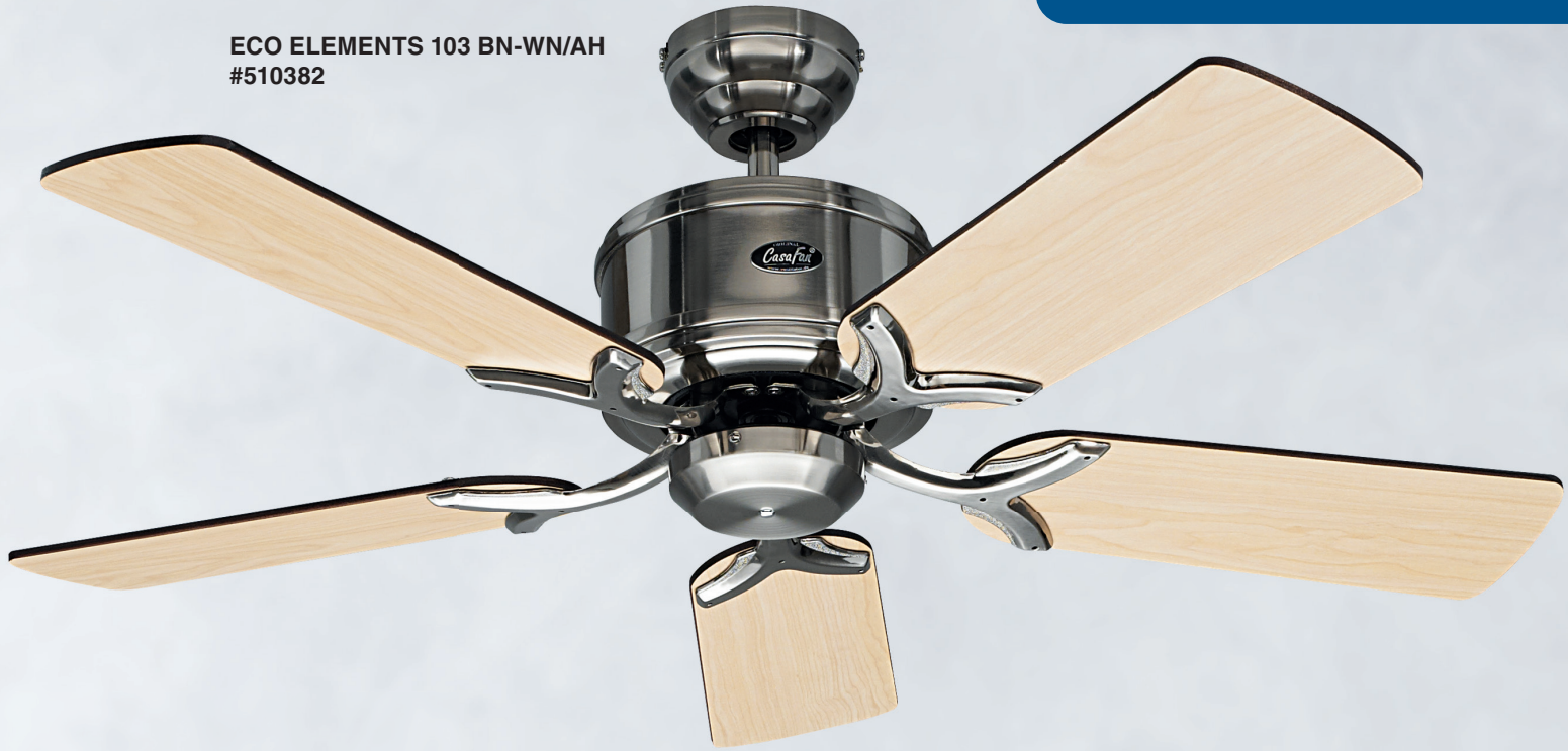
ECO ELEMENTS 103 BN-WN/AH #510382