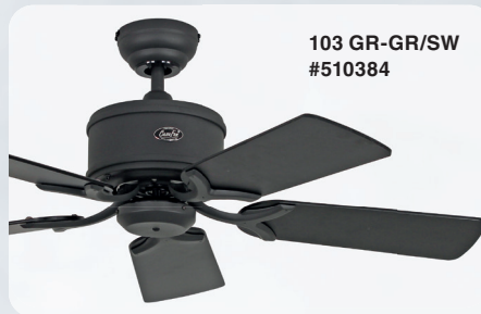
103 GR-GR/SW #510384