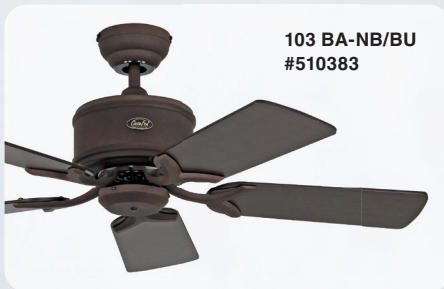
103 BA-NB/BU #510383