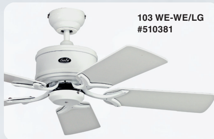
103 WE-WE/LG #510381