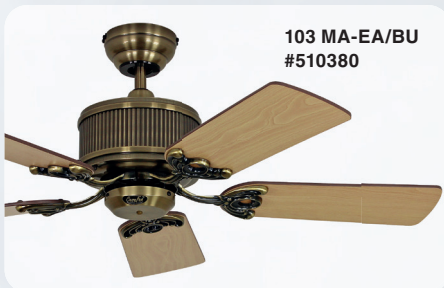
103 MA-EA/BU #510380