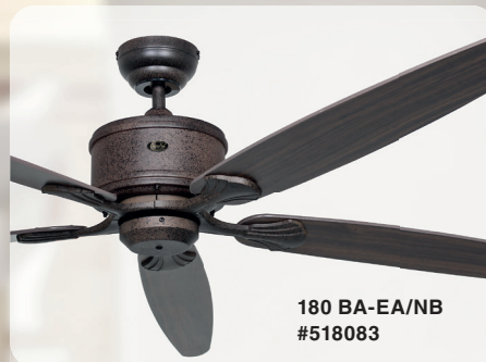
180 BA-EA/NB #518083