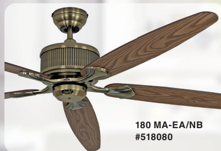
180 MA-EA/NB #518080