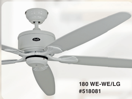
180 WE-WE/LG #518081