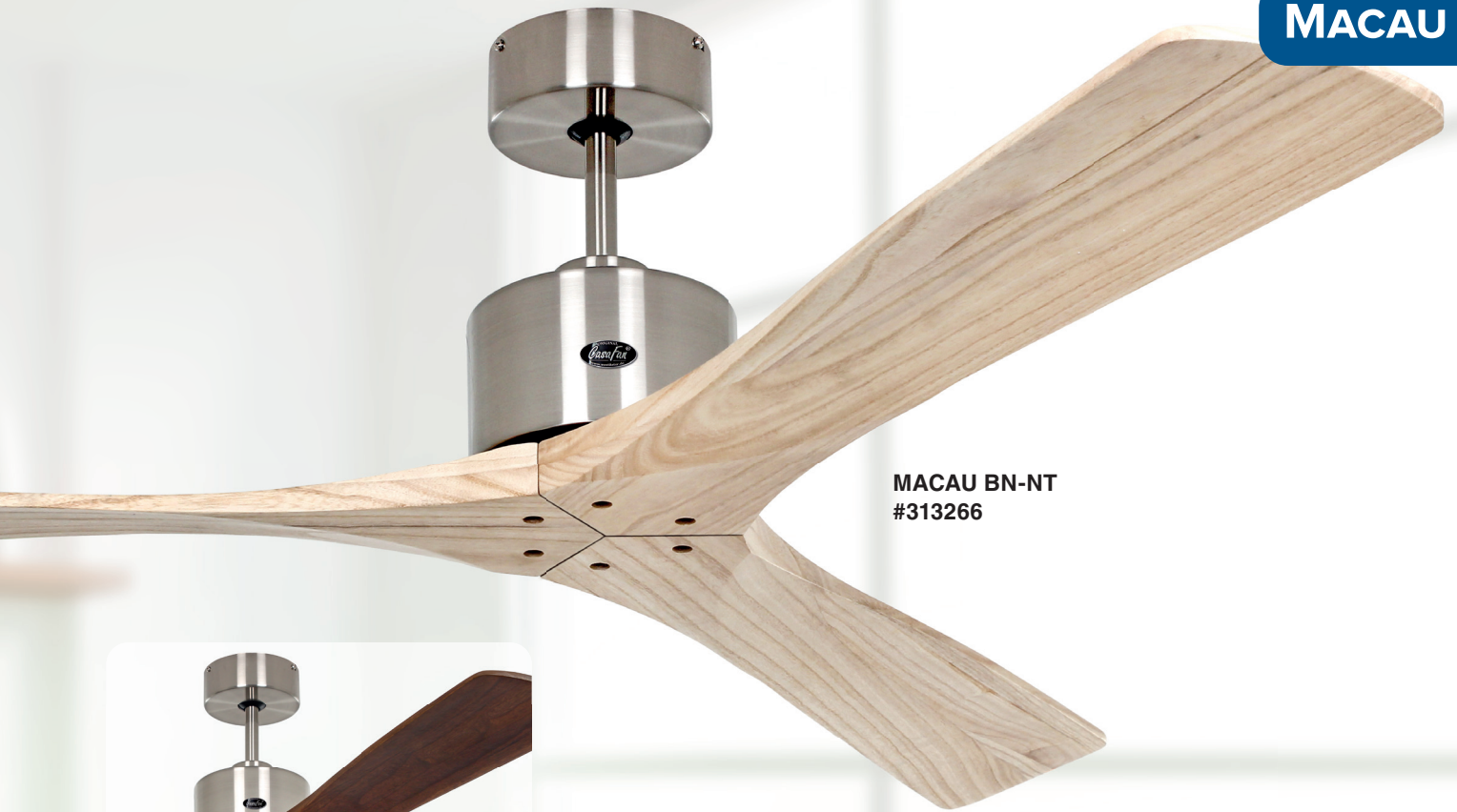
MACAU BN-NT #313266