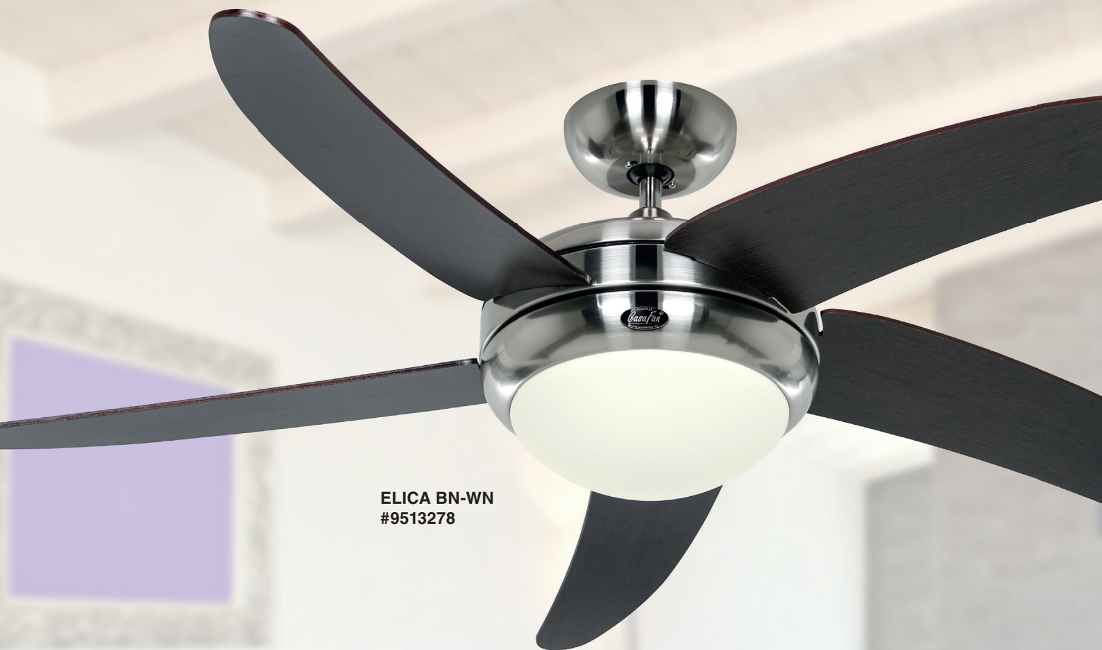
ELICA BN-WN #9513278