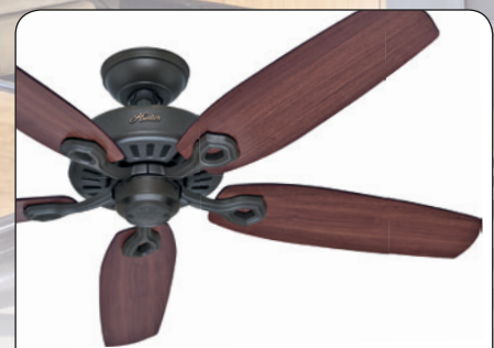
BUILDER ELITE NB #50567 Gehäuse New Bronze, Wendeflügel Brasilianische Kirsche(sichtbar)/Yellow Walnut