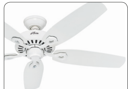
BUILDER ELITE WE #50565 Gehäuse Lack weiß, Flügel Lack weiß