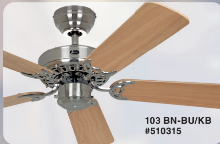
103 BN-BU/KB #510315