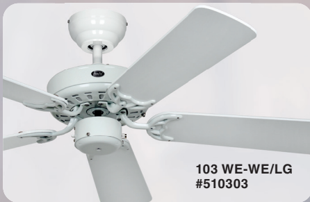
103 WE-WE/LG #510303