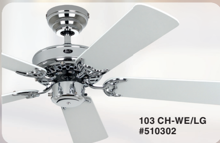
103 CH-WE/LG #510302