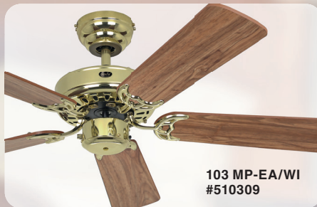
103 MP-EA/WI #510309