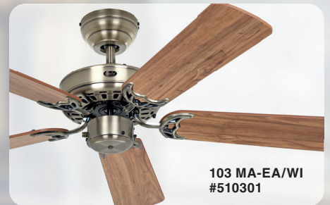
103 MA-EA/WI #510301