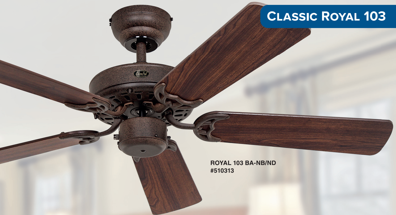
ROYAL 103 BA-NB/ND #510313